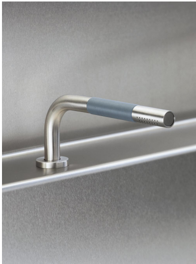
T1 Douche à main sur plan avec flexible de douche. Épaisseur du plan : max 45 mm. Percement du trou : 30 mm.