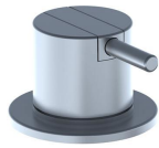
2500 Mitigeur sur plan (gros debit), levier de commande 25 mm.